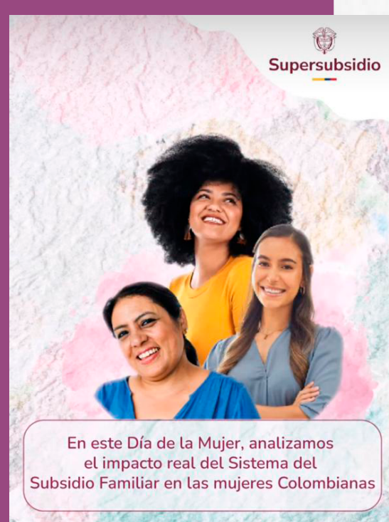
En este Día de la Mujer, analizamos el impacto real del Sistema del Subsidio Familiar en las mujeres Colombianas

¡Gracias por inspirarnos y hacer posible nuestro propósito!